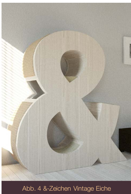
Abb. 4 &-Zeichen Vintage Eiche

Das aus Holz gefertigte Mobiliar, das auf den ersten Blick nicht nach einem für Katzen konzipierten Produkt aussieht, beinhaltet alle lebenswichtigen Funktionen von gewöhnlichen Kratzbäumen.