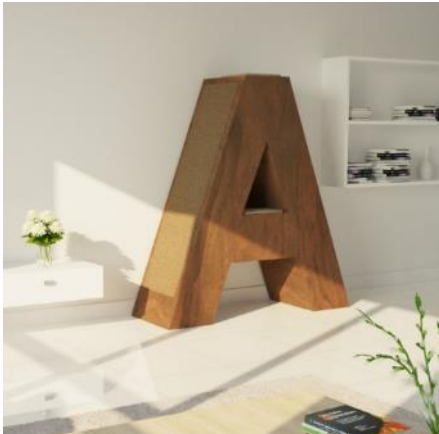
Abb. 1 Buchstabe A Furnier Nussbaum

KletterLetter: Exklusive Kratzmöbel in Buchstaben-, Zahlen- und Sonderzeichenform.