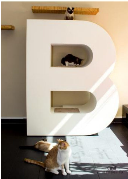
Abb. 2 Buchstabe B weißlackiert im Cafe Katzentempel München