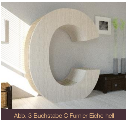
Abb. 3 Buchstabe C Furnier Eiche hell

(Düsseldorf, 22.07.2015) Das Start-Up Unternehmen Great Innovative Minds entwickelt die persönlichsten Luxus-Katzenmöbel der Welt.